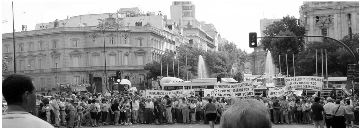
Miles de afectados se manifestaron en las numerosos actos reivindicativos organizados por ADICAE desde que estalló el fraude de Forum y Afinsa

Como se ha demostrado en otros escándalos financieros, la movilización coordinada y con unos objetivos claros, constituye una vía paralela fundamental a la vía judicial. Desde que se destapara el fraude de Forum y Afinsa, la Plataforma Unitaria promovida por ADICAE ha desarrollado una intensa labor reivindicativa para lograr el objetivo de dar una solución justa y rápida a este gran fraude contra el ahorro