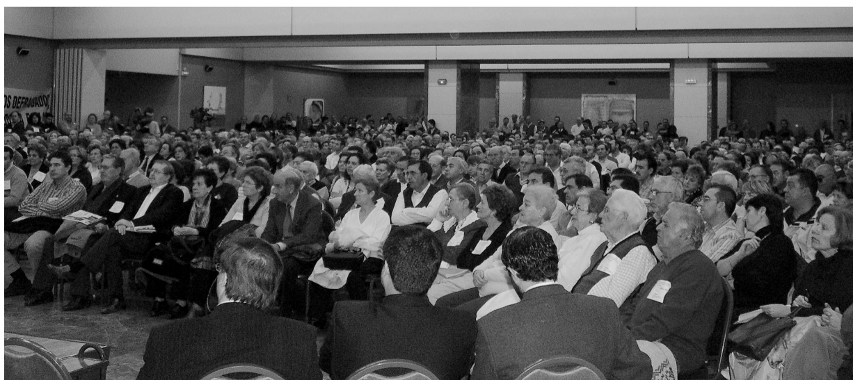
La numerosa participación de afectados ha sido, y sigue siendo, la nota predominante de todas las reuniones, asambleas y otros actos organizados por ADICAE a lo largo de este año por toda la geografía española

La Plataforma Unitaria de ADICAE ha defendido desde un principio, y seguirá defendiendo, la unión de todos los afectados en torno a unos objetivos claros para conseguir la mejor solución del problema, no dar palos de ciego y quemar las posibilidades de una actuación eficaz. Esto está intentando ADICAE desde el principio, que además ha constituido la mayor plataforma unitaria de afectados de Forum y Afinsa en toda España, que incluye ya a muchos colectivos y plataformas, está abierta a unirse y trabajar conjuntamente con cualesquiera grupos de afectados que defiendan unos objetivos claros para la defensa exclusiva de sus intereses. Pero como se ha demostrado a lo largo de todo este año, no todas tienen como único objetivo la defensa de los afectados, sino que muchas de estas agrupaciones son utilizadas como coartada y escudo para defender en exclusiva intereses de los directivos imputados acusados del fraude. Sólo esa