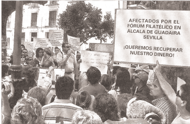
Afectados de Fórum Filatélico se concentraron ayer en Alcalá de Guadaíra, Sevilla.

El PP lanza también duros ataques contra la inoperancia por parte del equipo económico del Gobierno. El portavoz del Grupo Popular en el Congreso, Vicente Martínez-Pujalte, calificó ayer de «inadmisible» que el ex secretario de Estado de Hacienda, Miguel Ángel Fernández Ordóñez, sea nombrado gobernador del Banco de España «teniendo tras de sí la responsabilidad de no haber puesto los medios para que miles de familias hubieran evitado perder dinero». Pujalte declaró a Efe que quiere saber «cuándo se lo dijo al vicepresidente económico, Pedro Solbes, y a la ministra de Sanidad, y si tuvo alguna reunión para comunicárselo al presidente del Gobierno».