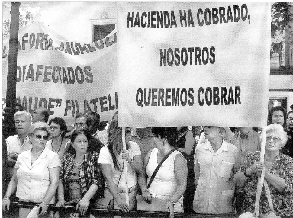
Un grupo de afectados de Fórum Filatélico denuncia a Hacienda y reclaman, ayer, en Sevilla que le entreguen sus ahorros. / CONCHITINA